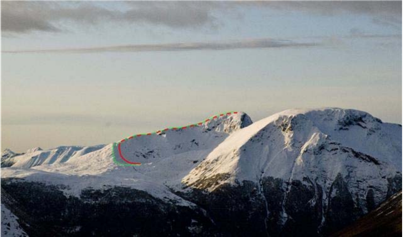
Bildet viser Veirahaldet- sløyfa. Samme vei opp og ned. Blåtind til høyre i bildet. (Dette bildet er fra oktober. Bildet under viser snøforholdene for øyeblikket.)